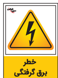
خطر برق گرفتگی

به همراه چسب دوطرفه رایگان برای نصب بر روی انواع سطوح