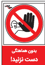
بدون هماهنگی دست نزنید!