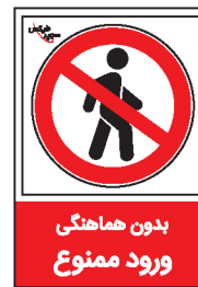
بدون هماهنگی ورود ممنوع