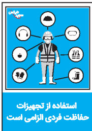
استفاده از تجهیزات حفاظت فردی الزامی است