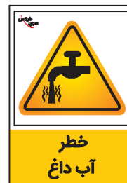
خطر آب داغ