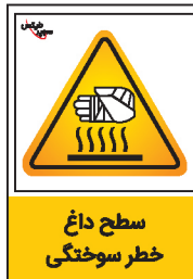
سطح داغ خطر سوختگی